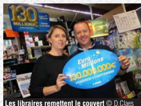
Les libraires remettent le couvert

Un ticket reprenant 9 chiffres et 2 étoiles, un autre de 6 chiffres et 2 étoiles, un troisième de 5